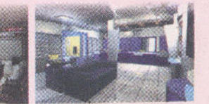
Nashik-Poona Road Br.