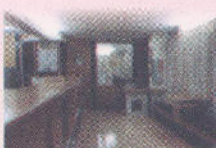
Sawarkar Nagar Br.