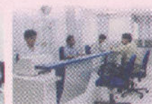
College Road Br.