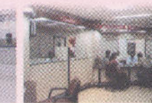
Mumbai Naka Br.